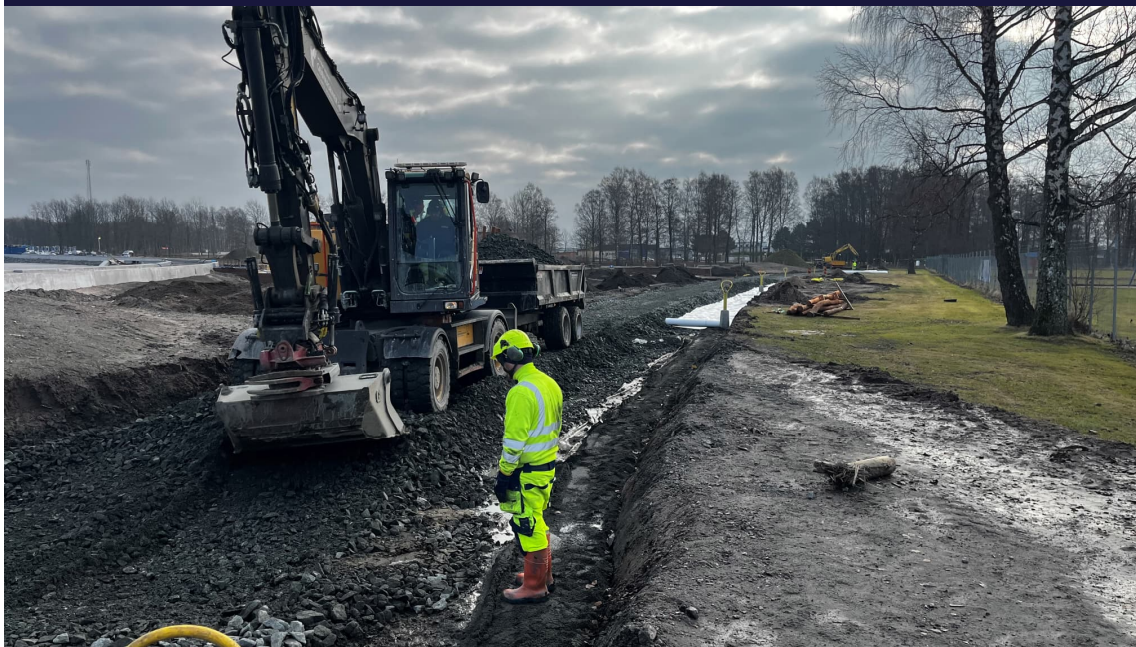
Just nu läggs förstärkningslagret ut för den kommande GC-vägen