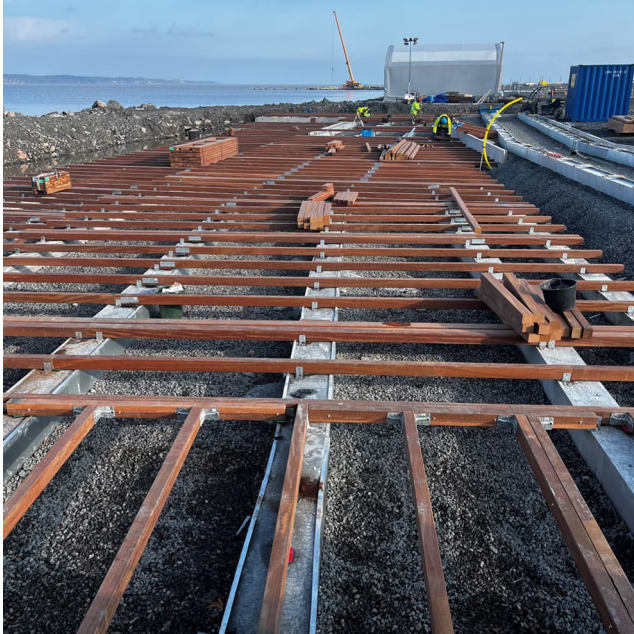
Noden montage av bärlinor för kommande trallyta

Vid trallytan norr om noden monteras just nu bärlinorna i trä för den kommande trallytan, betongsulor är gjutna för att bära upp konstruktionen på bästa sätt.